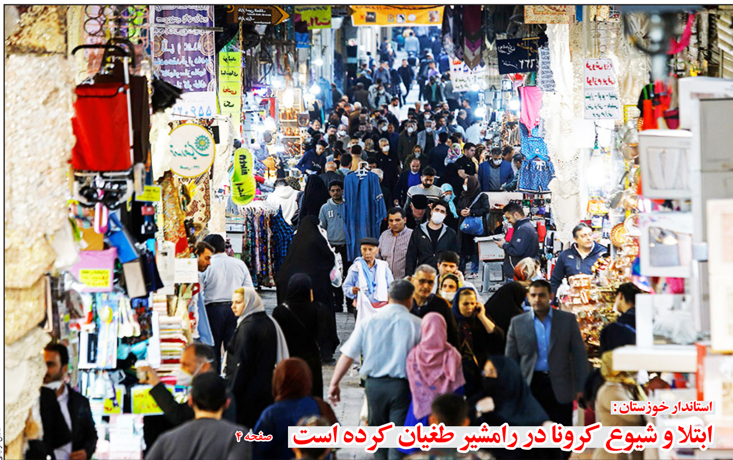
استاندار خوزستان: ابتلا و شیوع کرونا در رامشیر طغیان کرده است صفحه ۴

معاون دادستان اهواز: پرونده‌های در مجتمع قضایی امور جنایی و انقلاب اهواز تشکیل شده و افرادی که مبادرت به خرید و فروش و ساخت و ساز غیر مجاز نموده اند شناسایی و تحت تعقیب قرار گرفته‌اند. صفحه ۳