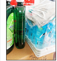
معاون سپاه حضرت ولی عصر (عج) خوزستان : اقشار کم بضاعت توان خرید اقلام بهداشتی را ندارند صفحه ۳