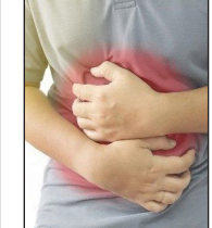
به دلیل نفوذ فاضلاب به شبکه آب شرب اهواز؛ فاز اول بیماری های روده ای شروع شده است صفحه ۳

سرپرست دانشگاه علوم پزشکی اهواز : سامانه نوبت دهی آنلاین آزمایش ازدواج راه اندازی شد صفحه ۳