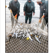
رئیس اتحادیه صیادی خوزستان : صید لنگری نان صیادان را آجر کرده است صفحه ۳