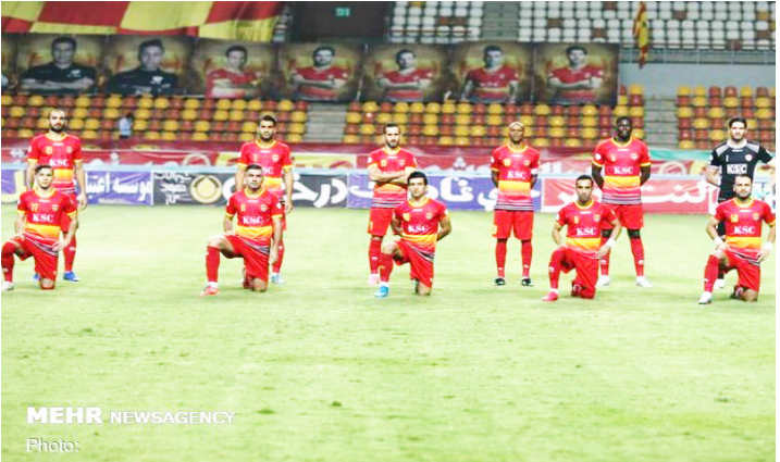
مردم خوزستان بوده که خط قرمز باشگاه فولاد است و این موضوع را از راه‌های قانونی پیگیری

علوی بیان کرد: راستی آزمایی تست‌های کرونای گرفته شده توسط تیم‌ها، نوعی توهین به وزارت بهداشت و اتهامی بزرگ به جامعه پزشکی کشور و ستاد مبارزه با کرونا است.