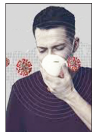
محقق ایرانی دانشگاه لایپزیگ آلمان: