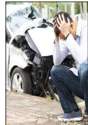
مدیرمجمع قضایی تصادفات خوزستان: