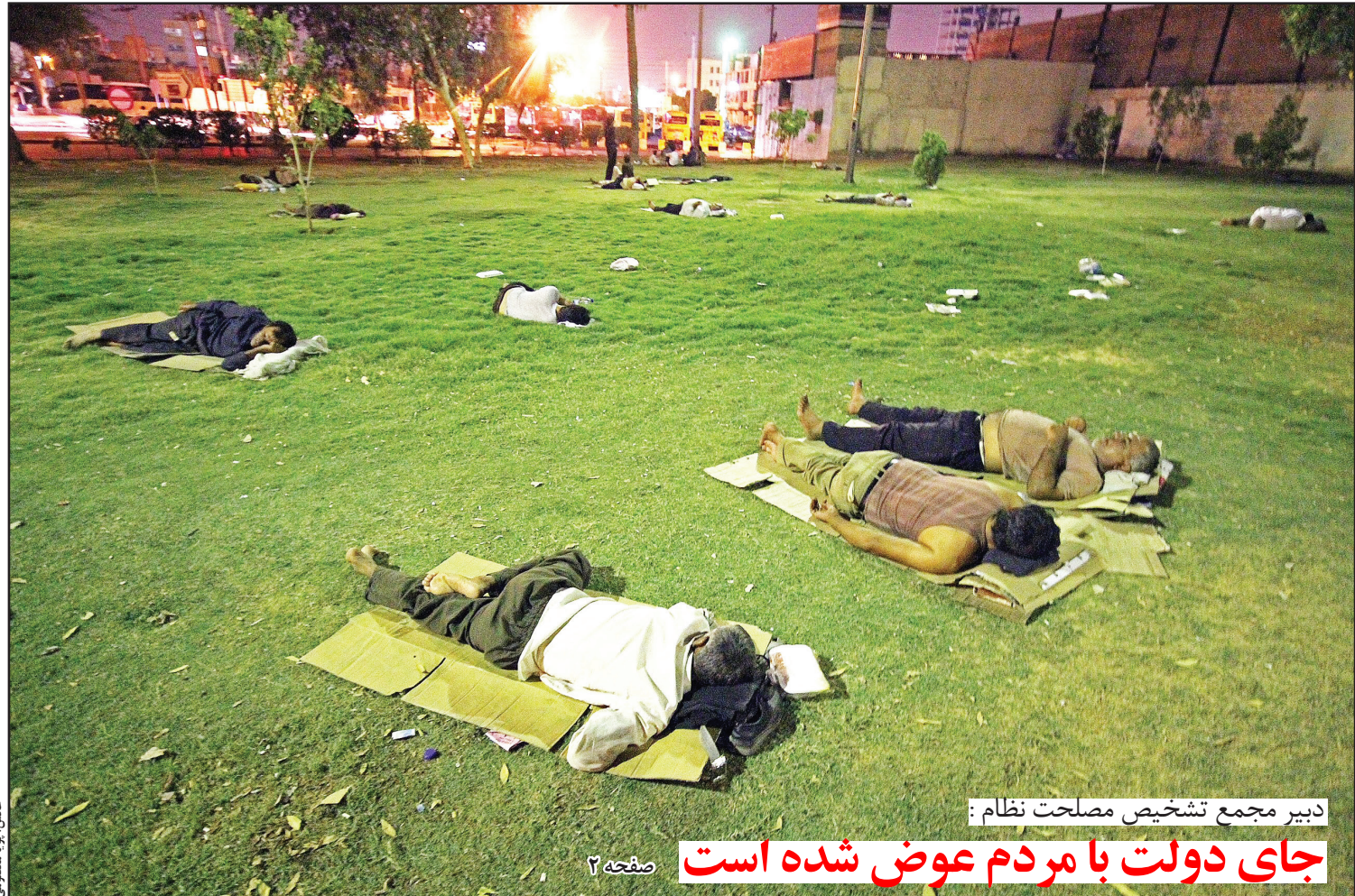
دبیر مجمع تشخیص مصلحت نظام: