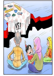
نماینده تبریز :

رئیس مرکز بهداشت خوزستان تصریح کرد: واکسیناسیون در خوزستان لاک پشتی حرکت می‌کند به طوری که در روز گذشته ۳۰۰ نفر نوبت اول، ۳۰۰ نفر نوبت دوم، ۸۰۰ نفر نوبت سوم و در نوبت چهارم نیز تنها سه هزار و ۵۰۰ نفر واکنس تزریق کردند که به کمتر از ۵ هزار دُز می‌رسد در صورتی که در گذشته روزانه ۵۰ هزار دُز واکنس نیز در خوزستان تزریق می‌شد.