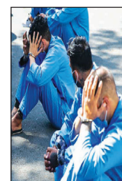
فرمانده فراجا :

هدر رفتن سرمایه‌های انسانی و مادی خیانت به کشور است