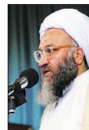
عضو مجلس خبرگان رهبری :

هدر رفتن سرمایه‌های انسانی و مادی خیانت به کشور است