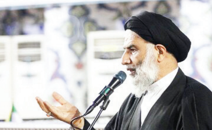
امام زمان (عج) است.